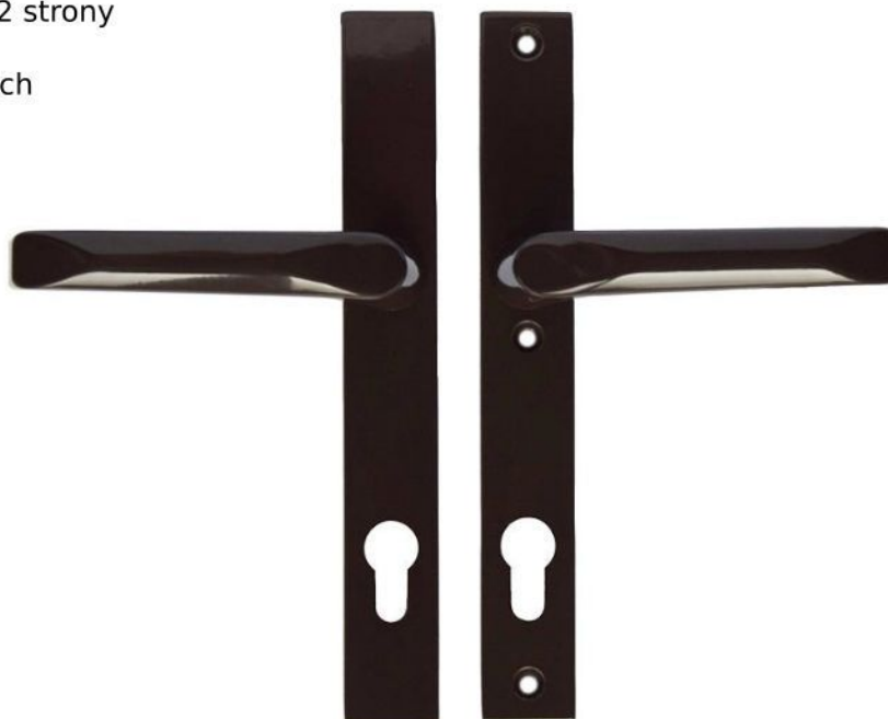
Rysunek: Klamka FAM 45.21.110