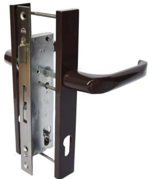
Zdjęcie: Klamka FAM 45.21.111 z zamkiem do drzwi Prawych