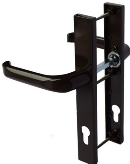
Zdjęcie: Klamka FAM 45.21.110 do drzwi Lewych